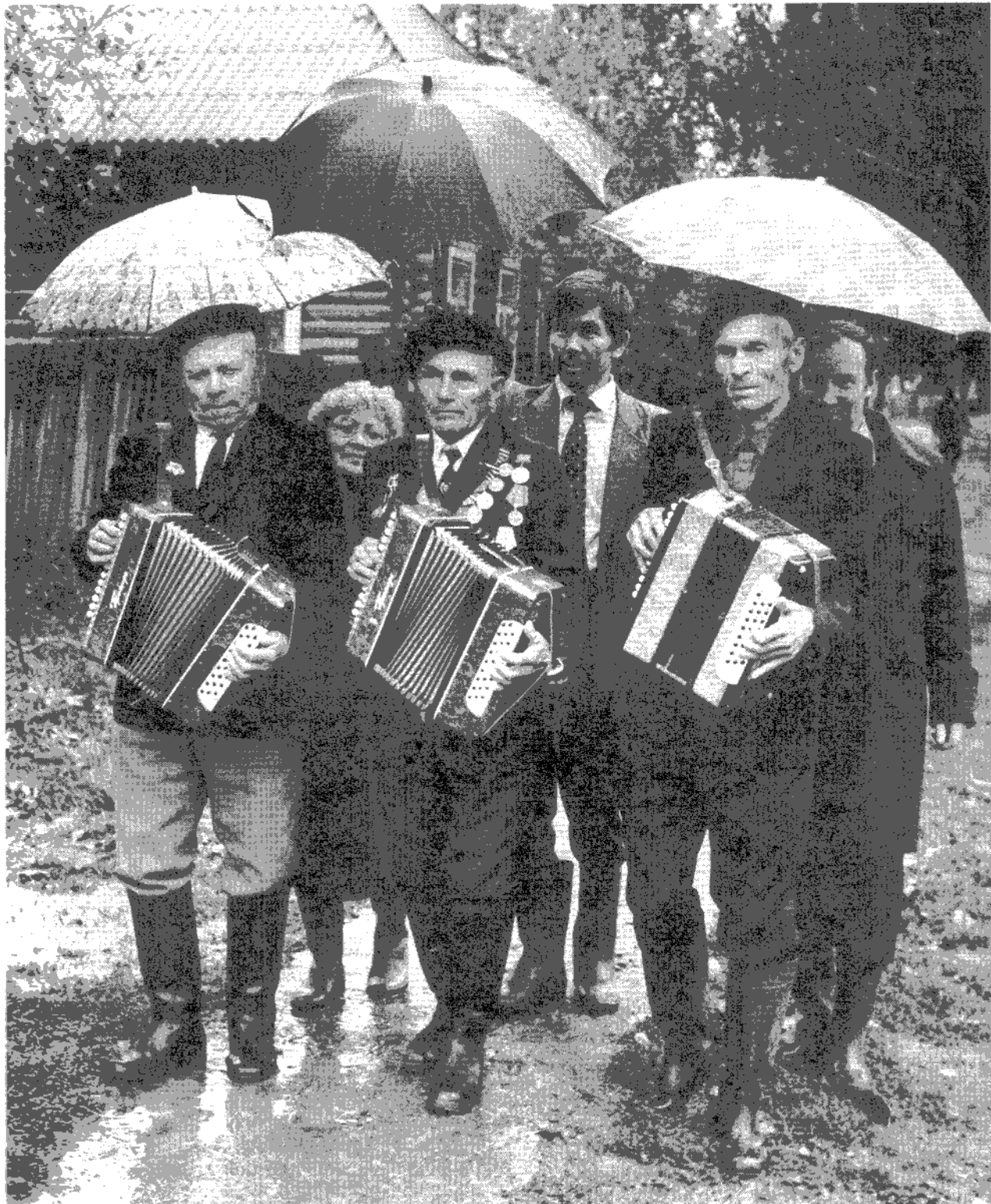
Победители. Пусть руки ваших потомков всегда держат только гармоника и никогда - автоматы