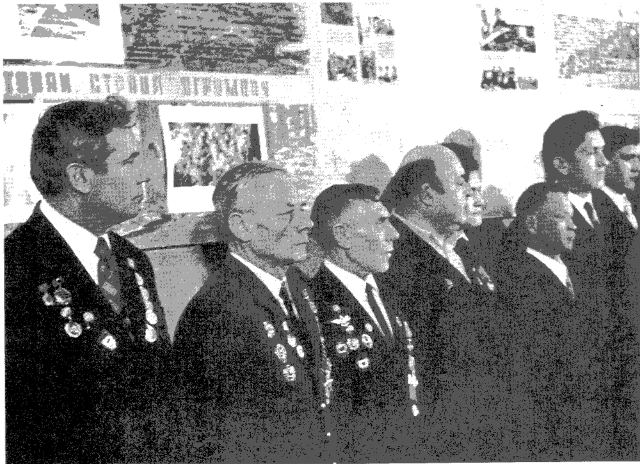
Фронтовики в зале боевой славы Усть-Ишимской школы

В 50-х годах к боевым наградам ветерана добавился орден "Знак Почета".